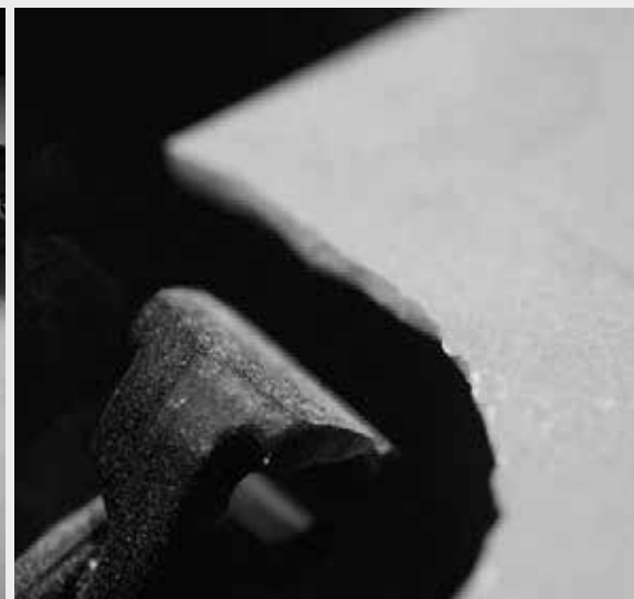
THE TILES' DUCTILE PROPERTIES MAKE THEM EASY TO CUT LAS PROPIEDADES ESPECIALES DE DUCTILE LO HACEN MÁS FÁCIL DE CORTAR