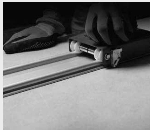
CUTTING DETAIL WITH GUIDE ON SLAB DETALLE DE CORTE CON GUÍA SOBRE PLANCHA

LA INSTALACIÓN DE GRANDES FORMATOS REQUIERE DE HERRAMIENTAS Y UNA FORMACIÓN ESPECÍFICA POR PARTE DEL COLOCADOR. A DEMÁS DE LAS ANTERIORES, ESTAS SON ALGUNAS DE LAS RECOMENDACIONES A TENER EN CUENTA EN LA INSTALACIÓN DE GRANDES FORMATOS CERÁMICOS: