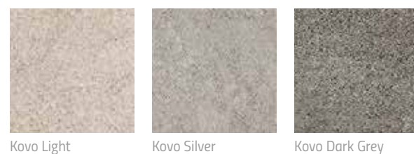
Kovo Light Kovo Silver Kovo Dark Grey