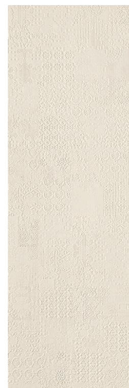
Déchirer XL Gesso 100-300 cm * 39"-118"

Modello depositato piastrelle n° 001615790-001 – data di deposito: 25/09/2009 Registered design n° 001615790-001 – date of registration: 25/09/2009 Modello depositato piastrelle n° 001615774-001 – data di deposito: 25/09/2009 Registered design n° 001615774-001 – date of registration: 25/09/2009