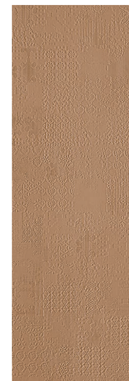
Déchirer XL Avana 100-300 cm * 39"-118"