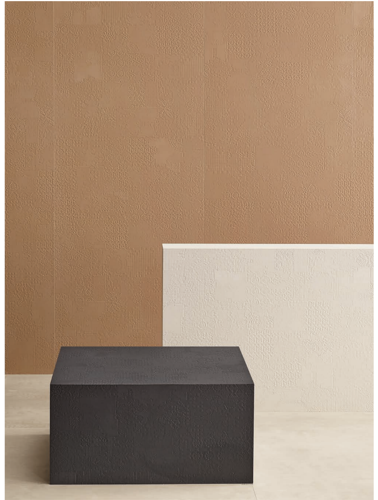
This page: Avana, Gesso, Grafite. Opposite page: Gesso.