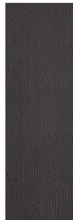
Déchirer XL Grafite 100-300 cm * 39"-118"