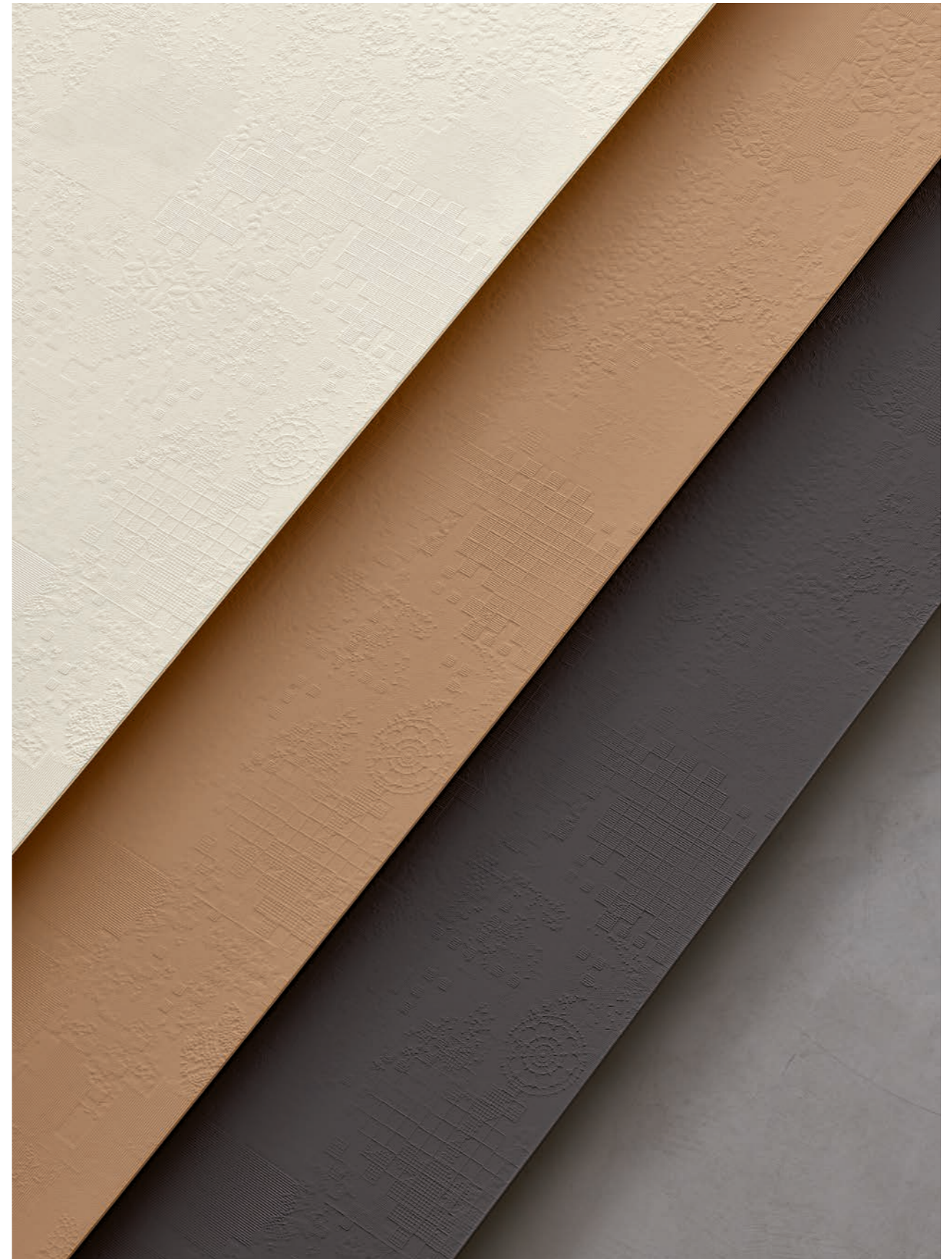
Gesso, Avana, Grafite